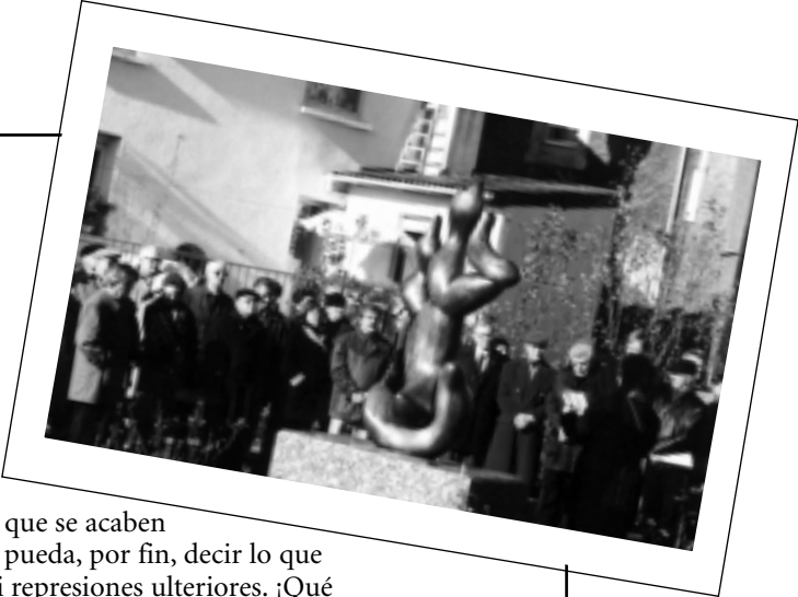
Artículo de Paca Rimabau