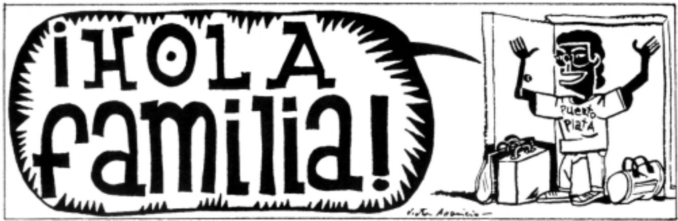
Dibujo de Victor Aparicio, de Los Coyotes