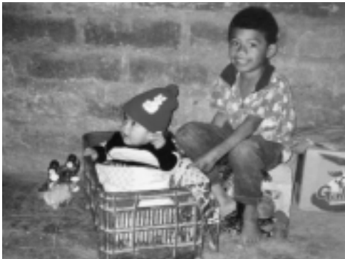
[Izda.] Manifestación de Hijos (asociación de hijos de desaparecidos) frente al Palacio presidencial el día de los desaparecidos. [centro] Familiares de las víctimas del conflicto orando frente a sus restos. [dcha.] La cuna de un bebé en la comunidad 3

Guatemala sufrió una de las peores guerras civiles de toda Latinoamérica. 200 000 muertos y desaparecidos de los cuales el 85% fueron indígenas mayas. Después de la firma de la paz en 1996, comienzan las exhumaciones del gran cementerio clandestino en que los militares habían convertido al país, y se inicia el proceso de recuperación histórica de la memoria. Las osamentas de las víctimas salen unas tras otras y los victimarios se pasean tranquilamente frente a los familiares de los muertos.